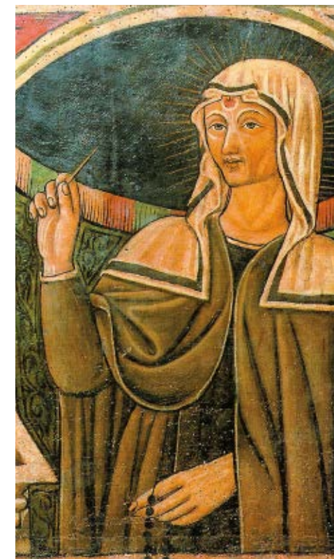
Image peinte sur le sarcophage de Sainte Rita.